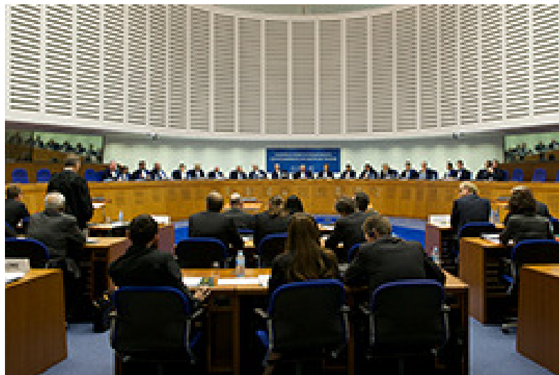
Anhörung beim EGMR